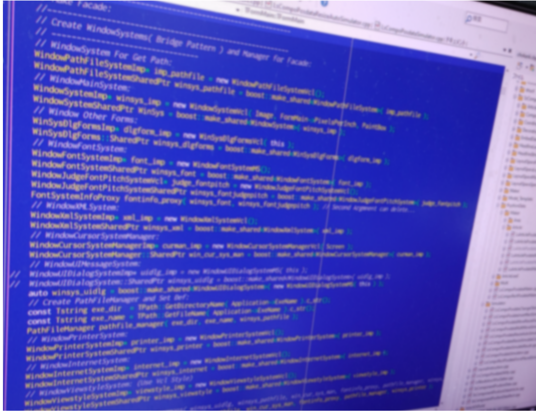
「朝刊太郎改」の開発画面(画像はぼかし処理)。ソースコードは計10万行を超える

新聞専用のDTPフリーソフト「朝刊太郎改」が正式公開された。記事操作だけでなく見出しや画像など新聞独自の編集が手軽に行える。20世紀末に初公開された旧「朝刊太郎」の後継版。基本操作はおおむね踏襲しつつ、大幅な機能強化が図られている。正式版としては18年ぶりとなる。