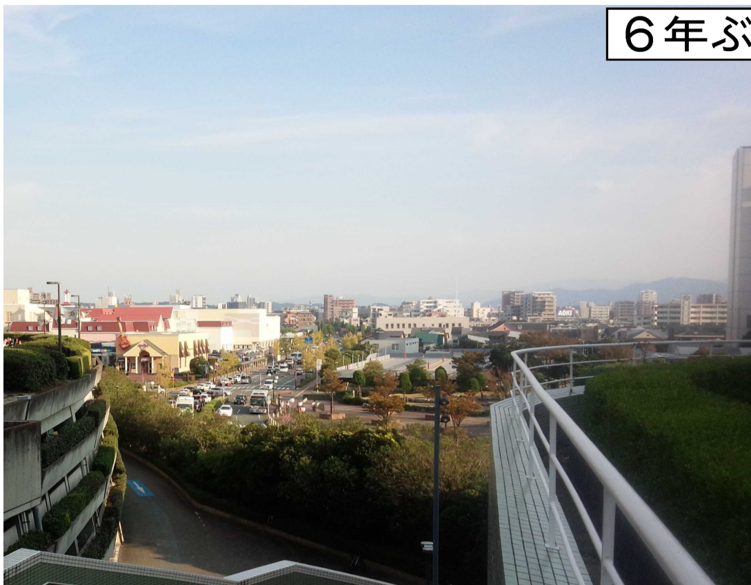
日本のどこかで作者が適当に撮影した写真（場所失念）＝写真は本文と全く関係ありません